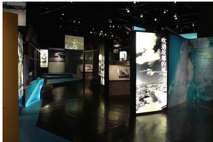
圖 2 科博館展場以藍色地面及發光面板，提示觀眾展場的主要動線