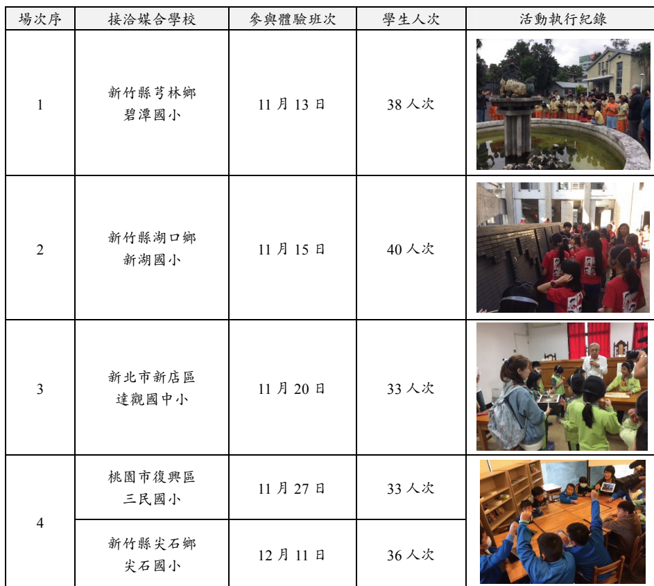
表 1 人權館 2018 年辦理「文化體驗教育課程」場次表（製表、攝影／鄧宗德）

人權館辦理文化體驗教育課程，2018 年 8 月起與文化部、教育部共同合作，於教育部所屬藝術教育館「藝拍即合」網站成立「文化體驗教育課程」專區，開放受理苗栗以北的國民小學媒合報名，共有新竹縣芎林鄉碧潭國小、新竹縣湖口鄉新湖國小、新北市新店區達觀國中小、桃園市復興區三民國小、苗栗縣竹南鎮海口國小、新竹縣尖石鄉尖石國小等學童分 5 場次前來參訪體驗。而桃園市三民國小、新竹縣尖石國小來自泰雅族部落，希望藉此促進原住民學童和老師，認識當年他們部落長輩，遭到白色恐怖迫害的人權事蹟。