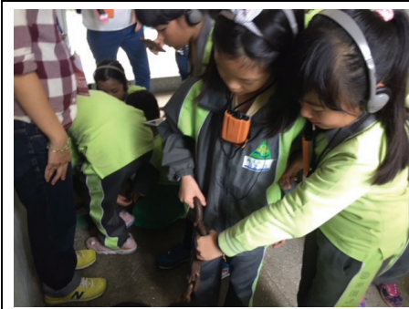
2018 年 11 月 20 日新北市新店區達觀國中小學童，實際體驗軍法看守所戒護刑具腳鐐，所帶來的身體束縛不自由感受。