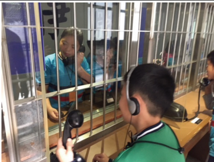
2018 年 11 月 29 日苗栗縣竹南鎮海口國小學童，在白恐景美園區面會室，體驗當年家屬和獄中親友見面時的心情。