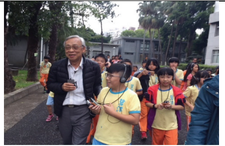
2018年11月13日政治受難者陳欽生前輩於人權博物館景美紀念園區不義遺址現場，向國小學童講述自己於白色恐怖時期被國家當局莫名逮捕審判的人權迫害遭遇。