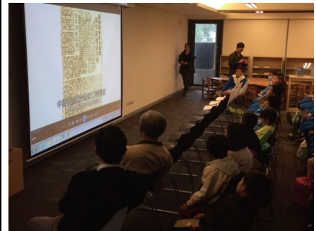
2018 年 11 月 27 日桃園區三民國小泰雅族學童，共同欣賞泰雅語版人權館簡介影片，用母語認識當年泰雅族前輩葉榮光老師的白恐遭遇。