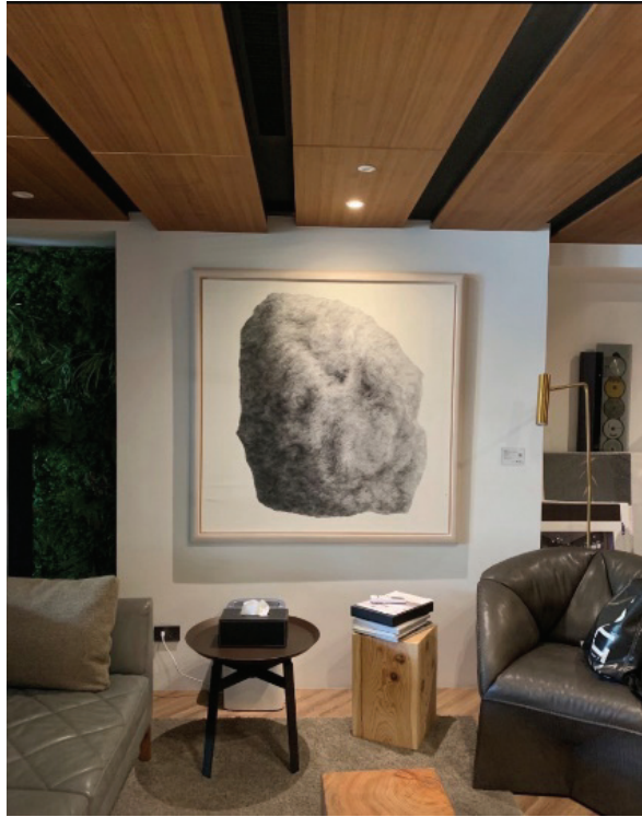
圖 2 當藝術走入日常。

有別於加拿大藝術銀行（The Canada Council administers the Art Bank） 2 早期係由評估委員會（Peer assessment committees）參觀加拿大各地的藝術家工作室和展覽，並決定哪些藝術作品將被收藏，另於 2022 年期間，藉由 50 周年之契機，邀請了藝術家主動提出申請。而澳洲藝術銀行（Artbank of Australia） 3 之購藏政策不受政府限制，透過藝術銀行之藝術諮詢董事委員會