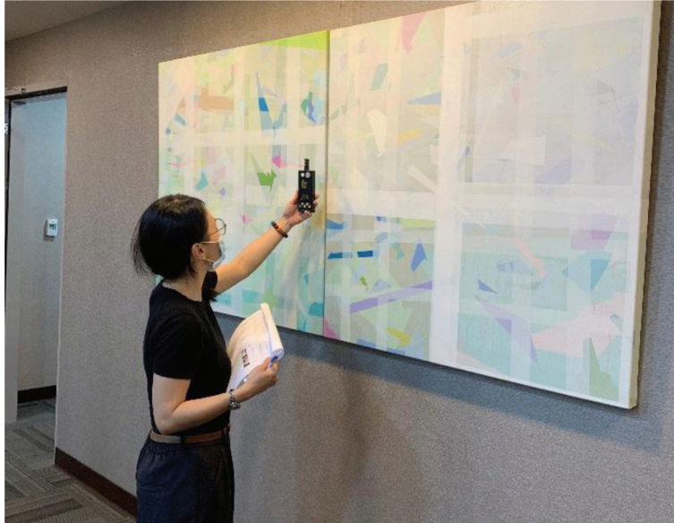
圖 6 續租評估之環境狀況確認。