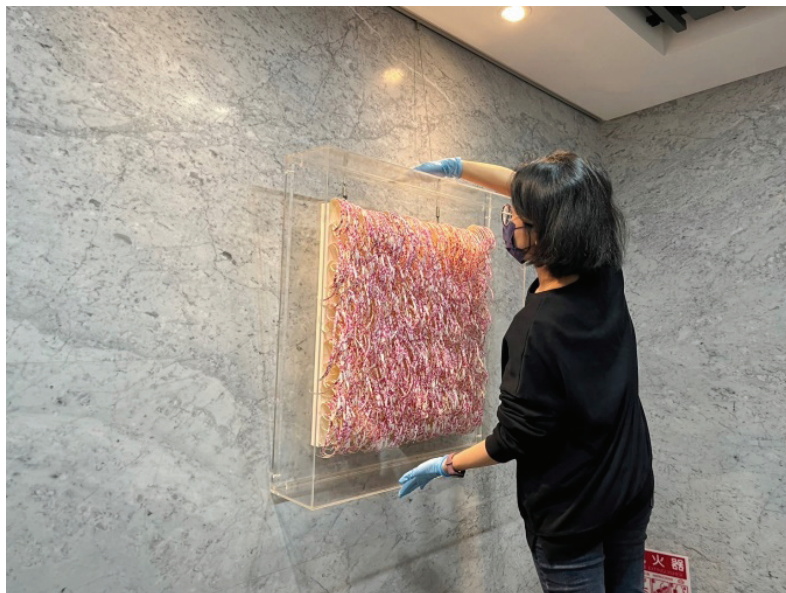
圖 7 續租評估之作品檢視與清潔保養。