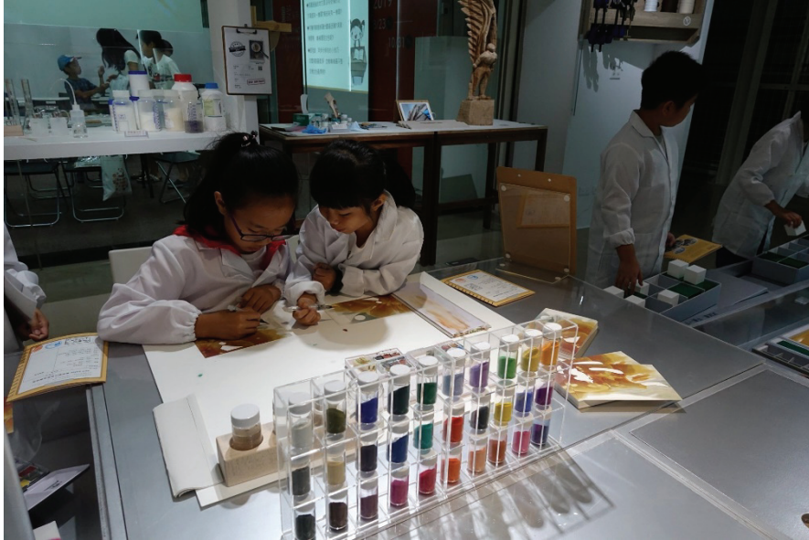
圖 9 「畫說保存維護」- 文物保存從生活做起。