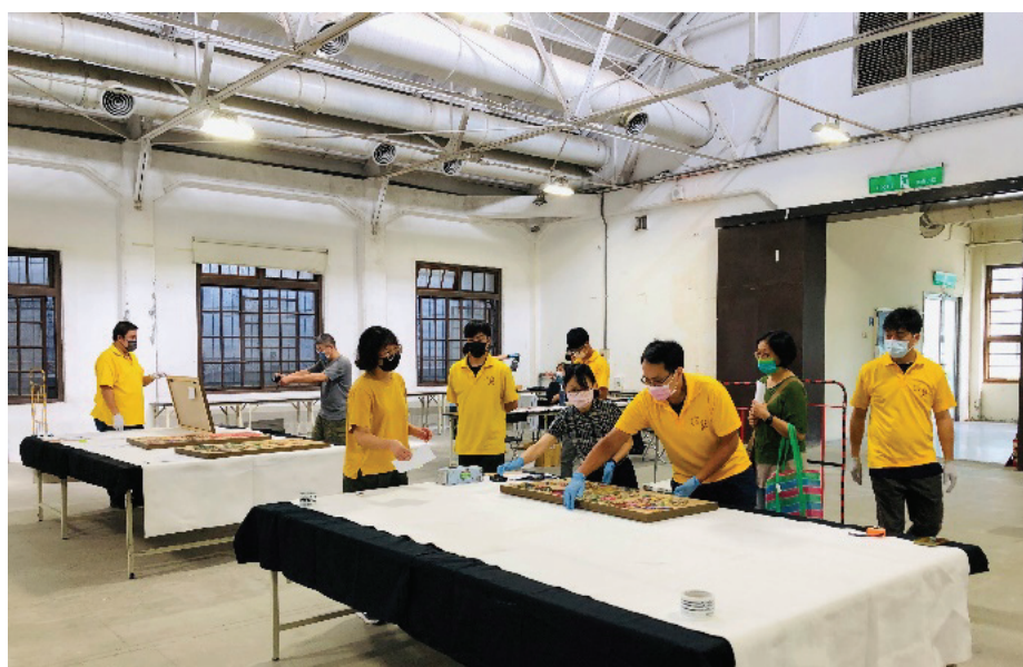
圖 3 藝術銀行複審收件，作品檢視現況。

徵件複審進行作品實體審查作業，在作品收件時，現場由臺美會修護師進行作品檢視動作，除了仔細進行微觀的作品狀況檢查（如圖 3），作品結構、裝裱及外框形制亦為檢視之環節，並於現場適時地與藝術家進行討論，掌握作品及展示之相關資訊，希冀能在第一時間確認作品的穩定性以及把握能夠跟藝術家確認作品在媒材、安裝及展示時的相關資訊，甚至在作品框裱、穩定度等面向有疑慮時，能進一步的跟藝術家一起討論，透過他們的專業與修護師一起找出最適合藝術銀行的形式，確保作品能夠在未來購藏後能以穩固完美的型態向大眾展示。