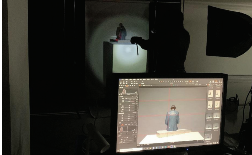
圖 5 數位圖像建置。