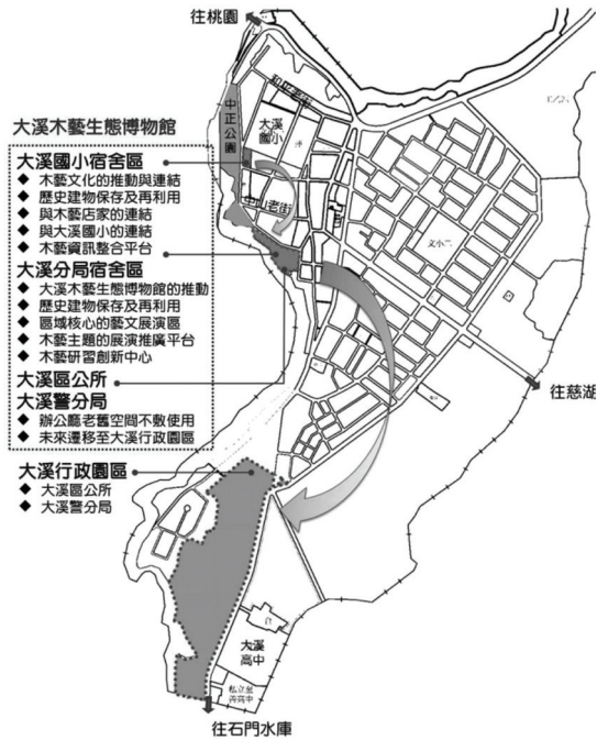
圖 7 大溪木藝生態博物館與大溪行政園區區位示意圖