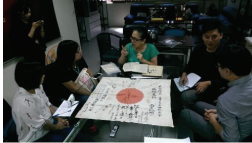
圖 3 大房豆干街角館日本國旗文物現地典藏

館、社頭、典範點（全昌堂）等網絡的建構，成為大溪除了前述妥善保存傳統建築，還以民間保存的有形與無形文資，典藏於居民生活空間從中彰顯生活文化，體現大溪文化現地典藏的願景。