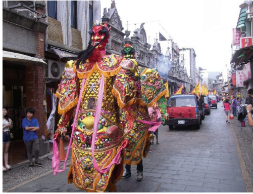
圖 5 普濟堂關聖帝君聖誕慶典暨遶境以「大溪大禧」品牌化