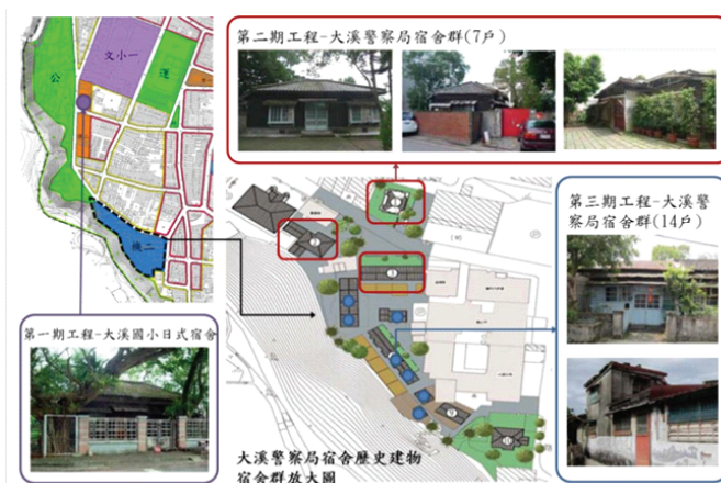
圖 6 2020 年桃園市「變更大溪都市計畫（第三次通盤檢討）」木博館區域示意圖 （引自更大溪都市計畫（第三次通盤檢討）（桃園市政府，2020））

大溪區公所與大溪分局原廳舍的進駐，符合木博館活用既有建築的精神，再結合陸續修復完成的傳統建築作為展館，串聯成大溪歷史廊道展演大歷史與傳統木藝文化。傳統建築保存與活用定位了木博館經營主軸，公有館串聯街角館與社頭組織的住民生活日常與產業空間，以及創生行動據點作為開放展演空間，印證了木博館以博物館的文化治理促進空間妥適治理，再以公有館、街角館、社頭……等上百處的文化熱點作公共參與的場域，帶領城市發展與社區營造更符合民眾需求與文化保存的真實性。周圍的郊區與農村地區，則是透過農場型或社區型的街角館網絡，致力於在地文化保存的新據點。