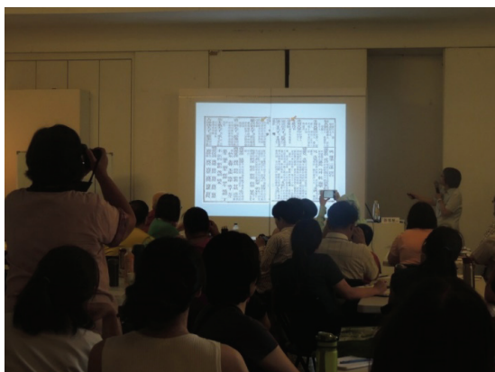
圖 2 2017 年大溪學機制中許雪姬老師歷史學課程