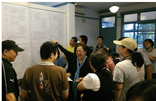
圖 1 2016 年大溪學共識營

與商圈、店家與住民等有大小歷史對話的機會。在教育方面，木博館也十分重視與大溪再地學校協力館外的教育推廣，促使大溪文化能扎根基礎教育。