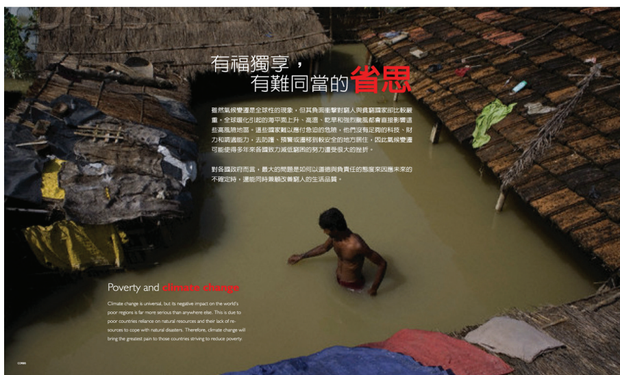
圖 5 氣候正義是全球暖化特展很重要的主題，策展人企圖透過這主題喚起大家注意到解決氣候變遷相關議題時，並不是單純是科學和科技的問題，而是一個社會問題。當富裕的北半球國家享受各種舒適生活的同時，而製造很少溫室氣體的南半球國家卻受到各種災難的侵襲，是很難讓這些國家信服的

在長期的演化下，各個地區都會發展出一些特有種。但隨著人類的經濟活動，各種異地的動植物也得以四處移動而成了外來種或入侵種。這些外來種往往有廣度的適應能力和高生殖力，因此對特有種的生存有很大的威脅，更影響了當地的生物多樣性，故常被稱為生態浩劫或災難。2004 年的災難性議題莫過於紅火蟻所引起的外來種生態問題，同一時間，臺灣好幾所博物館都舉辦了較小型的紅火蟻特展和稍後推出規模較大的外來種特展，以更有系統的內容介紹臺灣所面臨的外來種問題。不意外地，有些博物館在規劃外來種特展時，朝著以傳達科學資訊為主的策展方式。展示中依序介紹臺灣常見的外來種。為加強觀眾的印象，展示的設計風格還把外來種比喻為十大通