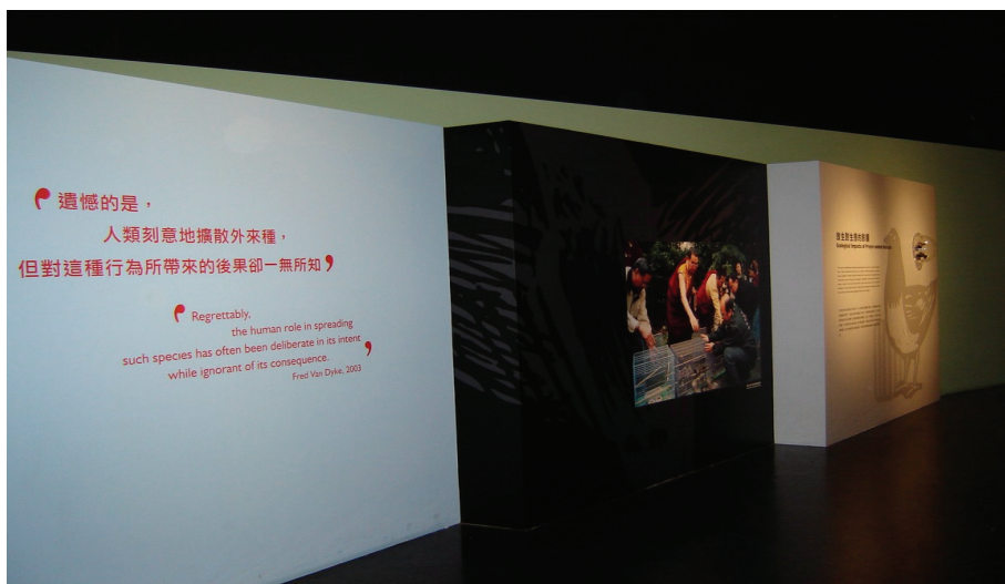
圖 7 《外來種》特展中介紹人類放生行為造成外來種任意的擴散，但我們對這種行為所帶來的災難卻一無所知

我們生活在一個動盪不安的地球上，各種自然地質變化都會造成很大的災難，再加上人類發展所衍生的各種環境災害，都影響著人類未來的永續發展。面對這些議題，現代博物館必須更積極地扮演溝通媒介的角色，勇敢面對爭議性議題，規劃發展相關的詮釋性展示和教育活動（也應融入各館的環境教育課程中），扮演一個對話的平臺，讓社會大眾不是只有記住表面的科學事實，也不單單看到恐嚇式的內容，而是朝向平衡敘事和融入社會議題，協助參觀者建構展示背後的意義，引發思考和促進參與公共政策的對話，才能真正地提升每個人的「國民科學素養」，進而影響其生活態度與行動，形成具有深度意義的博物館溝通。