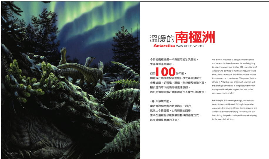
圖 3 科博館《全球暖化》特展一開始就指出在地球歷史裡，氣候是多變的，例如在一億多年前，南極洲是溫暖而且佈滿了茂盛的森林，也曾有不少恐龍在此生活，而不是我們今天熟悉冰天雪地的地貌

氣候變遷與人類演化也有很密切關係。古人類學家稱這段演化史為「東城故事」，因為八百萬年前發生於東非的造山運動讓非洲東岸隆起，這種地形改變了氣候，雨水分布也隨之發生變化，在降雨量下降後，東非的植物組成由原來的森林型態轉變為耐旱的草原型態，人類的祖先應該是在這種生存環境的改變下，被迫逐漸放棄樹棲生活而轉到地面上活動，並因此演化為二