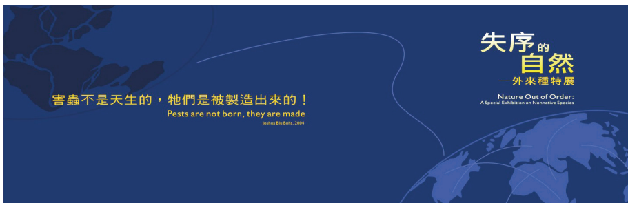
圖 6 科博館《外來種》特展特別強調人在這生物災難過程中所扮演的角色，特展入口處的視覺意象就非常明顯的呈現這一理念

科博館也在 2005 年初推出《外來種》特展，但策展方向並不刻意突顯外來種有著多麼猙獰的面孔。相反地，策展團隊認為外來種的現況其實都是人類為滿足自己各種慾望所造成的。因此在展廳入口處，就開宗明義的用了學者在探討外來種時的觀點，認為「害蟲不是天生的，而是被製造出來的」(Buhs, 2004: 38) (圖 6)，為整個特展企圖探討人的角色作了最好的註解。在介紹各種常見的外來種動植物時，策展團隊特別將這些動植物固定在美感十足的藝術相框裡，因為團隊認為沒有必要去醜化那些並非出於自願而到達臺灣的外來種。其實策展團隊這樣的做法是想融入社會學的觀點到一個表面是純科學的議題上。因此在展場適當的位置，用了顯眼的標題文字，例如在探討宗教放生時就加入了「遺憾的是，人類刻意地釋放外來種，但對這種做法所帶來的後果卻一無所知」來提醒觀眾反思自己的行為 (圖 7)。所以當觀眾離開展廳時，策展團隊希望他們在面對外來種的問題時，其實能反省自己希望吃到什麼樣的美食，還有我們後花園想要觀賞哪些漂亮的花卉和飼養哪種寵物，外來種問題其實就是人類慾望的問題。同一個主題的特展，不同的定調，便有不同的詮釋效果。