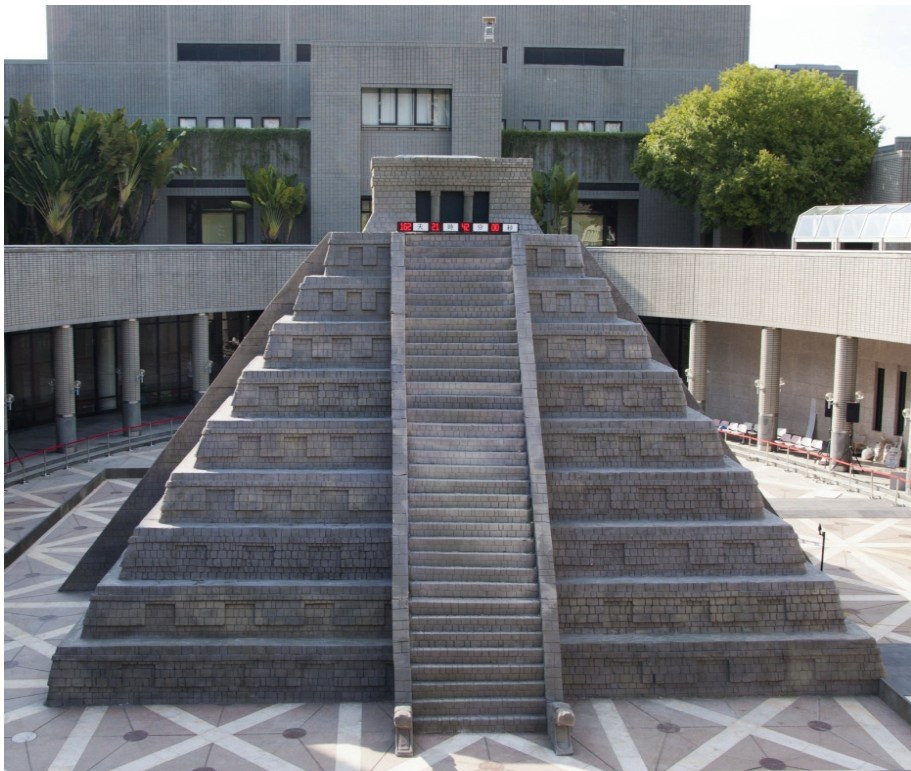
圖 1 放置在科博館中央廣場的馬雅神殿，在階梯的最上方架設了一座末日時鐘，倒數著從 2013 年 7 月 12 日開展日到 12 月 21 日傳說中馬雅人預言的末日那天所剩的天數

這種現象和 Doherty 所談的必須要溝通科學的第四種情形十分相似，也就是當社會普遍被迷思概念所影響時，科學家或學術單位是否應該要站出來扮演解惑者的角色？事實上，在 2012 年底左右，美國國家航空暨太空總署 (National Aeronautics and Space Administration, NASA) 的科學家特別推出專題網站，以問題與回答方式反駁世界末日的傳說 (NASA, 2012)。同樣在臺灣，有許多與天文學和物理學相關學者也都紛紛拍攝短片放在網路上，以導正世界末日的迷思。科博館也在 2011 年末開始規劃與 2012 年世界末日有關的展示，並由具備天文學背景的館長孫維新教授負責策展。